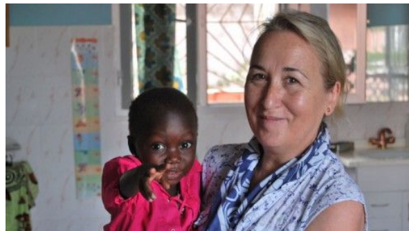
Una nostra collaboratrice – Sostegno in Guinea Bissau