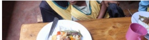
Mensa del Centro Mangafaly in Madagascar